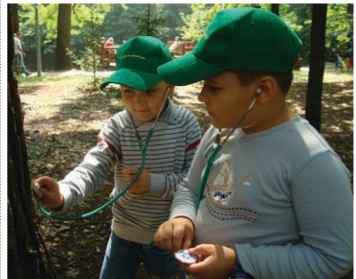
Послушаем, как дышит дерево?

ГБУ «Центр реабилитации и досуговой работы с инвалидами «Братеево» Наша адреса: район Братеево, ул. Ключевая, 12, корп. 1; район Язлыково, ул. Шипиловская, 48, корп. 1. Телефоны для справок: 8 (495) 240-61-09; 8 (499) 782-60-18. Приглашаем всех в наш центр! Здесь вам всегда рады!