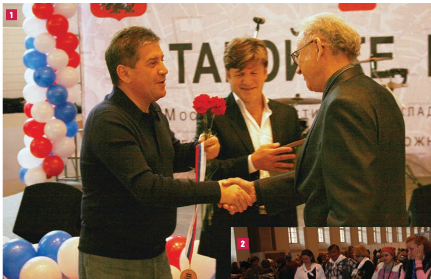
1 Владимир Петросян от души пожелал победителям новых творческих побед 2 В залах Манежа было на что посмотреть

— Ведь за всеми этими прекрасными работами — а многие из них можно смело называть произведениями искусства! — стоит огромный труд людей, которым на создание своей, даже небольшой поделки нужно приложить много усилий, порой преодолевая себя, свою боль. Но для таких людей занятия творчеством — это своего рода панацея в борьбе со сложным заболеванием. И по тому количеству людей, которые пришли на