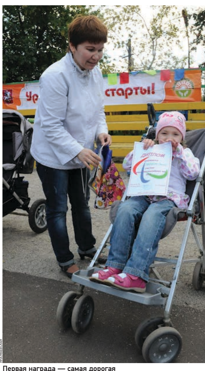
Первая награда — самая дорогая