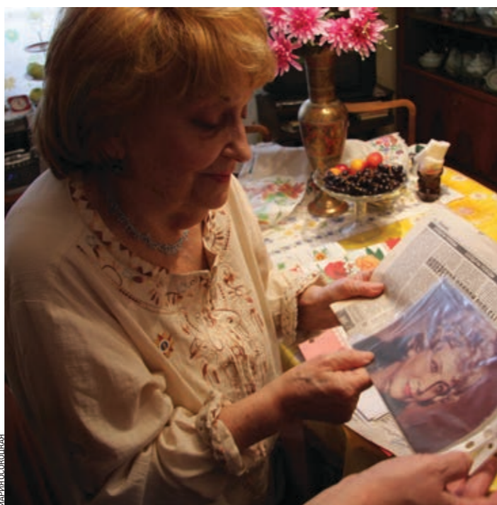
А годы летят, наши годы как птицы летят