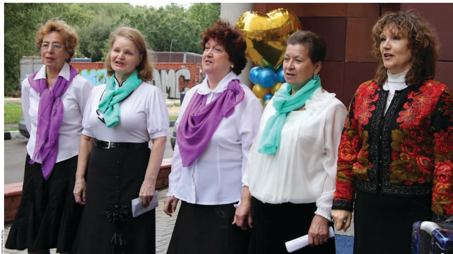
Ансамбль «Росиночки» из Центра социального обслуживания «Котловка»