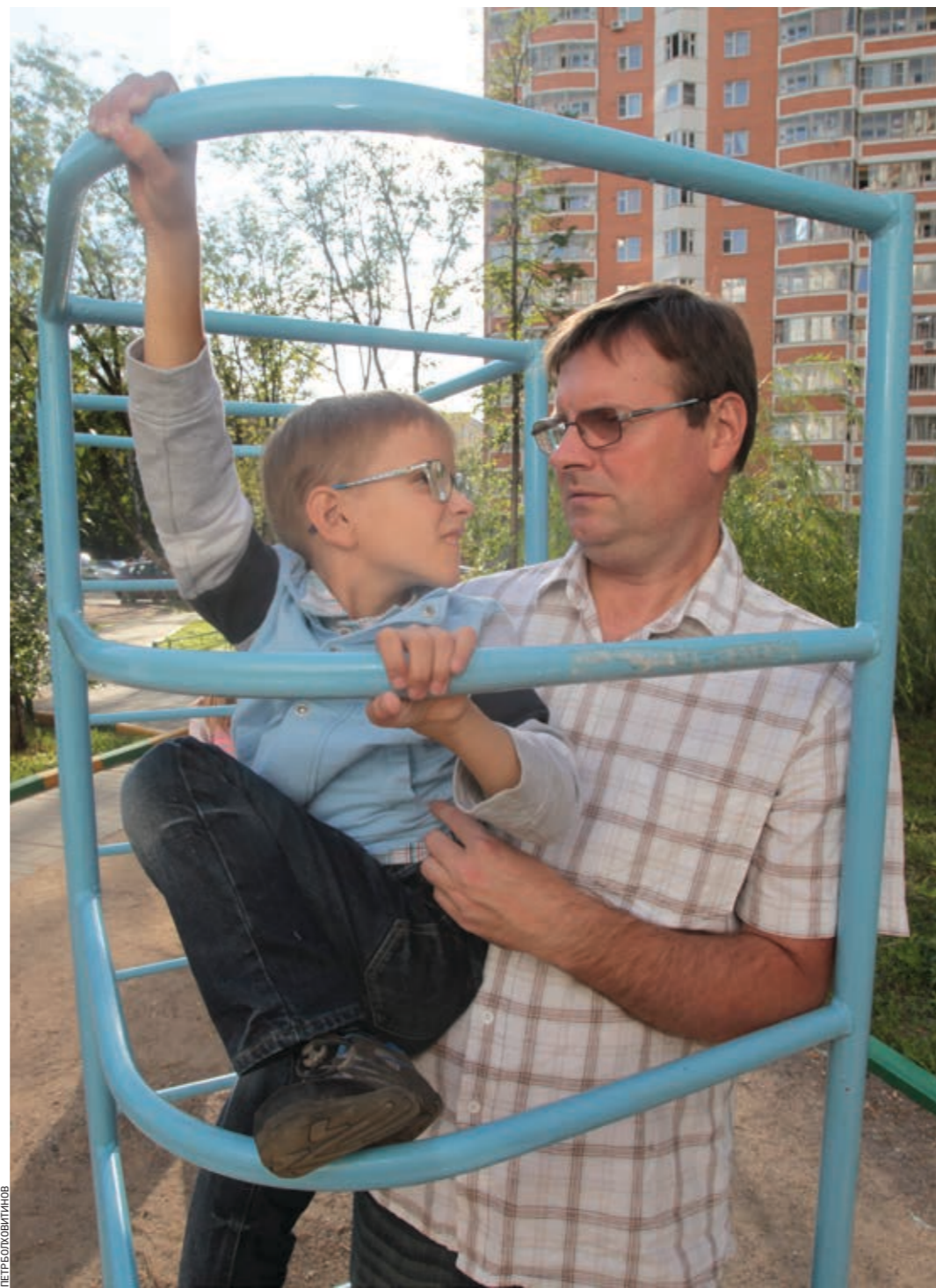
Папа с сыном ест о чем посекретничать

по сравнению, скажем, с различными другими тифлоприспособлениями, к которым и «сговорилками», как их в народе прозвали, дает сто оч-