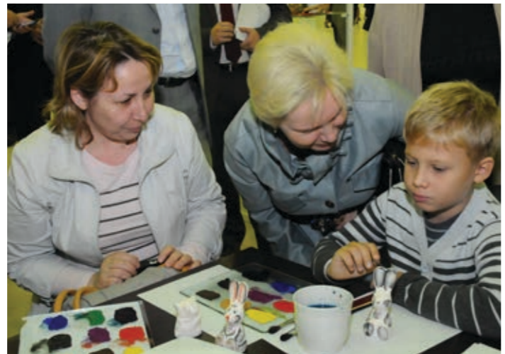
В рамках выставки прошли мастер-классы для ребят