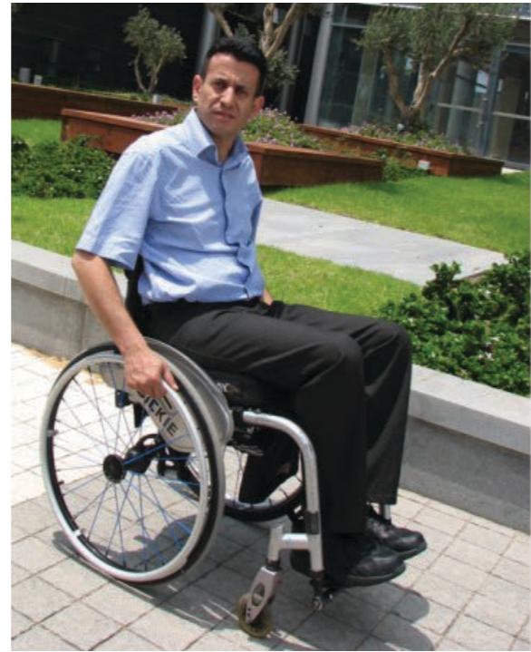
Высокие технологии приходят на помощь людям

На выставке мне довелось увидеть, как инвалид-колясочник, человек, который давно уже утратил способность передвигаться самостоятельно, благодаря такому роботу смог встать, сделать несколько шагов, присаживался и снова вставал, мог подниматься и спускаться по ступенькам — словом, обрел давно им забытую свободу движения. Я, кстати, сам встал в этот робот, в эту конструкцию и он меня «повел», ощущение очень необычное, ощущение легкости, комфорта и безопасности — что очень важно, конечно, для инвалидов. Другое высокотехнологичное средство реабилитации нового поколения носит название экзоскелет — это такая легкая