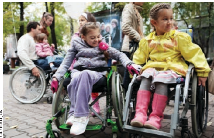
И дети и взрослые должны иметь равные возможности